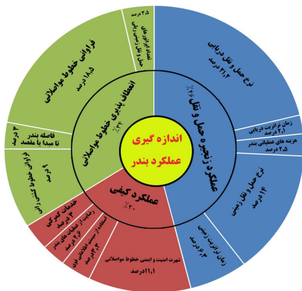
نمودار ۲- اندازه‌گیری عملکرد بندر، مؤلفه‌ها و شاخص‌ها