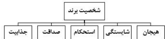
نمودار ۱- چارچوب شخصیت برند، آکر (۱۹۹۷)

اساس آکر (۱۹۹۷) مفهوم ویژگی انسانی را برای برند اعمال کرد و ضمن الهام گرفتن از مدل پنج بزرگ اقدام به ایجاد مدلی برای سنجش شخصیت برند کرد که ابعاد آن عبارتند از: هیجان، شایستگی، استحکام، صداقت و جذابیت. این ابعاد در نمودار (۱) نشان داده شده است.