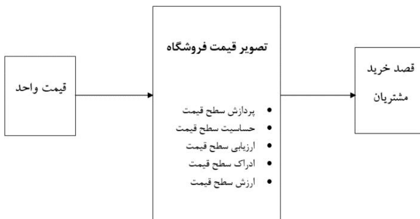
نمودار ۱- الگوی مفهومی پژوهش [۱]، [۲] و [۳]

با توجه به مفاهیم و فرضیه‌های بیان شده، مدل مفهومی پژوهش به صورت نمودار (۱) طراحی و تبیین شده است. این مدل نشان دهنده متغیر قیمت واحد به عنوان متغیر مستقل، قصد خرید مشتریان به عنوان متغیر وابسته و تصویر قیمت فروشگاه به عنوان متغیر میانجی است که از پژوهش‌های کراچی (۱۳۹۴)، شادمهری (۱۳۹۵) و روت و همکاران (۲۰۱۷) استخراج شده است.