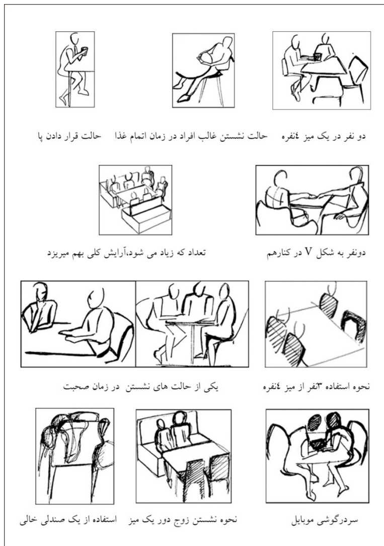
نمودار ۳- معمول‌ترین حالات رفتاری مراجعین به رستوران

زمان حضور آن‌ها ثبت شده است. در زمان مشاهده، تلاش بر یافتن مشکلات و رفتار غالب افراد در ارتباط با مبلمان رستوران بوده است تا اطلاعات عمیق‌تری برای یافتن مؤثرترین ویژگی‌های مبلمان برای افزایش خوشایندی و احساس خوب نسبت به آن به دست آید. با توجه به عدم امکان عکاسی